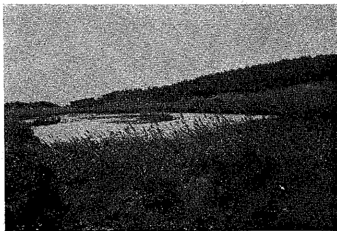
Det romantiske Yssingkær.