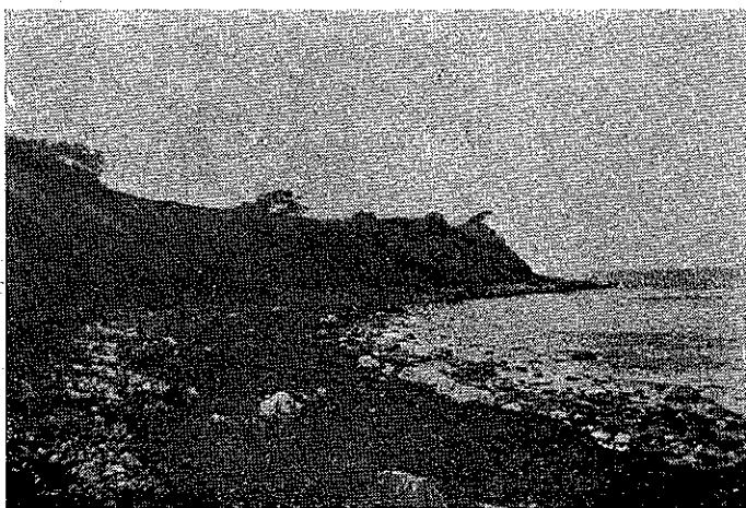
Svaleklints forblæste Skrænter.